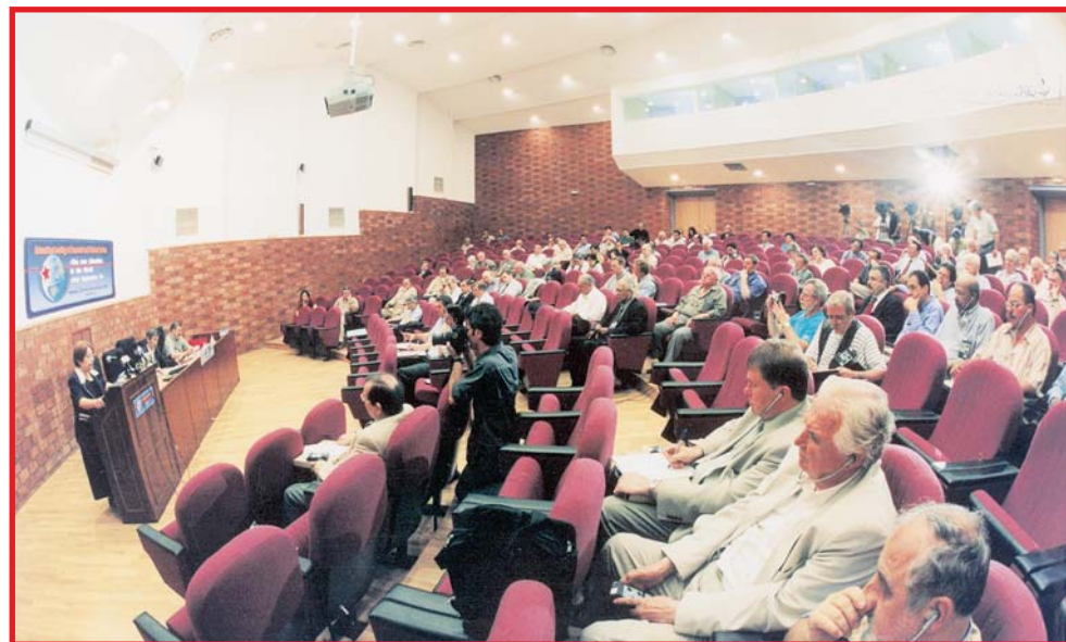
Encuentro Internacional de Partidos Comunistas Y Obreros en Atenas, 21.6. 2002, con el tema: «La situación internacional después del 11 de Septiembre 2001»

Una otra unidad de la intervención de la Secretaría General del CC del PCG fue: Los Partidos Comunistas, el movimiento democrático, antiimperialista, antimonopolista, y los movimientos