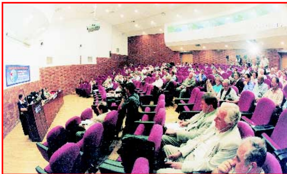
Konference Komunistických a dělnických stran v Athénách 21. 6. 2002 s tématem Mezinárodní situace po 11. 9. 2001

V další části své analýzy se gen. tajemnice KSŘ zabývala tématem: Komunistické strany, demokratické, antiimperialistické, antimonopolní hnutí a hnutí proti kapitalistické globalizaci. Tato část referátu hovořila o „válce proti terorismu“, o mechanismech útlaču, o mezinárodním charakteru boje. Došla k závěru, že „je neo-